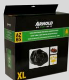
Housse de protection Réf. : 2024-U1-0003